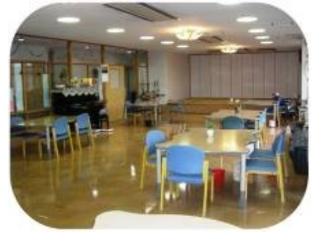
通所リハビリテーション